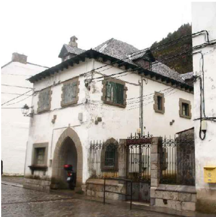
Fig .-01 Casa del Párroco