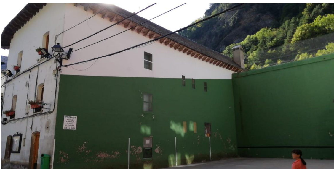
Fig .-02 Antiguas Escuelas